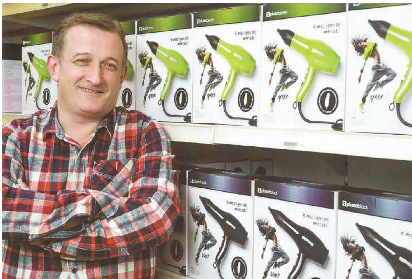
El Secador Puma es uno de los productos estrella de Hair & Beauty.

papel del distribuidor, el peluquero optimiza sus stocks. También le ayuda a rentabilizar su inversión en producto.