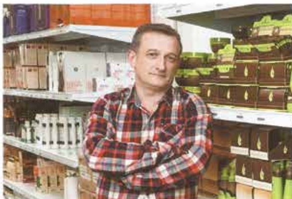
Hair & Beauty es distribuidora en exclusiva de Macadamia Oil.

Con toda seguridad el valor añadido es que, gracias al